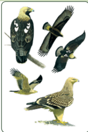
Grafika: Kókay Szabolcs

A parlagi sas hazánk egyik legnagyobb ragadozómadara, szárnyfeszítávolsága akár a 210 cm-t is elérheti. Az öreg, ivarérett példányok sötétbarna színezetűek, amelyből csak világos aranyszínű fejük és változó méretű fehér vállfoltjaik tűnnek ki. Az elsőéves fiatalok tollazata világos homokszínű, mely az ivaréérés öt éve alatt, átmeneti tarka tollruhákon keresztül éri el a felnőttek sötétbarna alapszínét.