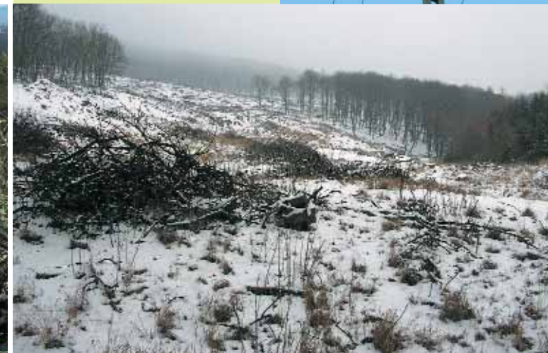
Az intenzív erdőgazdálkodás – különösen a véghasználat – a hegyvidéki fészkelőhelyeket veszélyezteti.