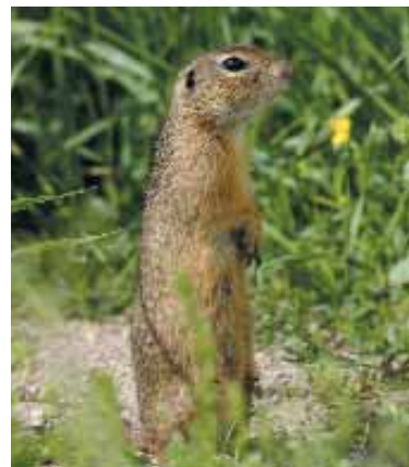
A parlagi sas legkedveltebb zsákmánya az ürge.

Bár továbbra is a legjelentősebb táplálékforrás a hörcsög, előtérbe kerültek a mezei nyúl és a közepes méretű madárfajok is (galamb, varjak, szarka, fácán, stb.). Alkalmanként elhullott állatokat is fogyaszt, elsősorban télen vagy kóborlaskor, de gyakran vesz el zsákmányt más ragadozófajoktól is.