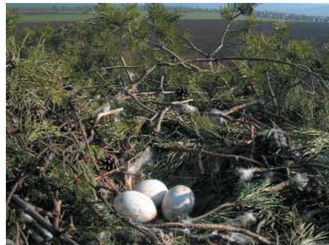
A fészkek megközelítése áprilistól június elejéig a tojások vagy kis fiókák pusztulását eredményezheti – egy elhagyott fészkelő.

Alkalmas fészkelőhelyek hiányában a sasok gyakran alacsony, gyenge fákra építenek fészket, amelyeket a nyári viharok lesodorhatnak. Mindezek a tényezők ma is negatívan hatnak az állományra, ennek ellenére szerencsére évről évre egyre több új parlagi sas pár telepszik meg hazánk területén, bár a jelenlegi állomány még mindig csak töredéke az egykorinak.