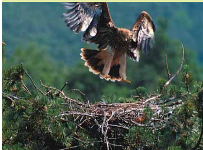
A fiatal madarak alapszíne világos.

Hazánk és Szlovákia uniós csatlakozásával az Európai Unió parlagi sas állománya a korábbi 1 párról (Kelet-Ausztria) közel 110 párra emelkedett. Sajnos azonban nem tudhatjuk, milyen hatással lesznek a hazai parlagi sas állományra a Magyarország Európai Unió csatlakozásával várhatóan bekövetkező földhasználati változások. A LIFE program során erre és egyéb, a faj megőrzéséhez fontos kérdésekre próbáltunk választ kapni.