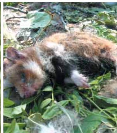
Hörcsög maradvány a fészekben.